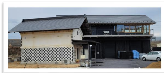
▲レストランと震災を乗り越えた蔵